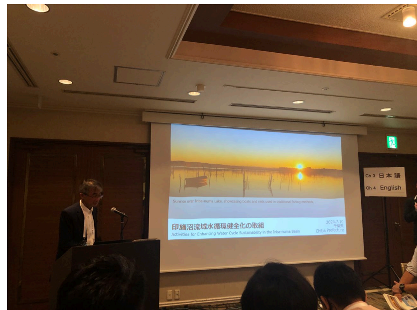
河川環境課 森川課長による紹介