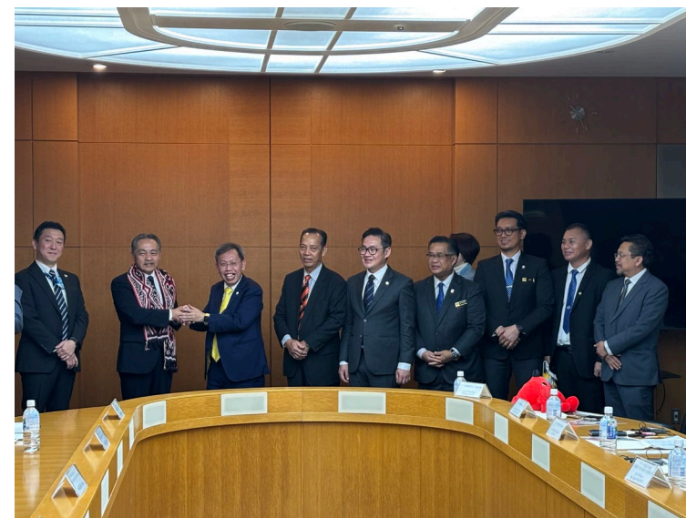
副知事、県土整備部長、視察団の記念撮影