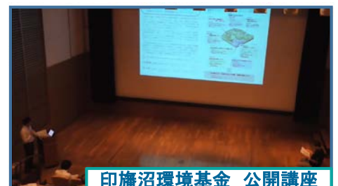
印旛沼環境基金 公開講座