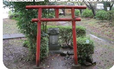
巖島神社（元は弁天様!?)

元は弁天様（水に縁のある七福神の1人）を安置していましたが、1994～1995年頃、子どものいたずらにより、石碑が池に投げ込まれ、なくなってしまいました。そこで、新しく巖島神社の碑を建てることになったそうです。