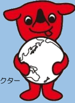
千葉県マスコットキャラクター 「チーバくん」